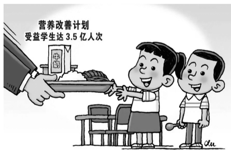
营养改善计划 受益学生达3.5亿人次

习近平总书记在党的二十大报告中强调:“坚持以人民为中心发展教育”“完善人民健康促进政策”。不久前,教育部等七部门联合印发《农村义务教育学生营养改善计划实施办法》(以下简称《办法》),为进一步加强和改进农村义务教育学生营养改善计划工作提供了有力政策保障。农村义务教育学生营养改善计