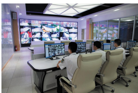
内部资料 免费赠阅