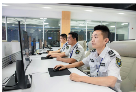
编辑单位:台儿庄区融媒体中心