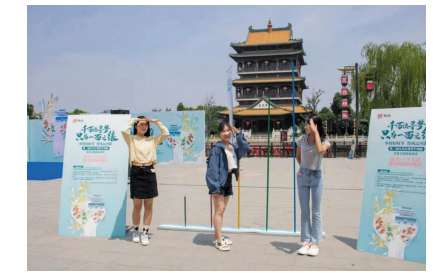
“立竿无影”互动活动