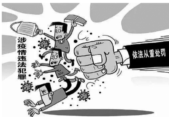
8月3日,江苏省扬州市公安局 所、棋牌室、农贸市场等,导致新冠肺