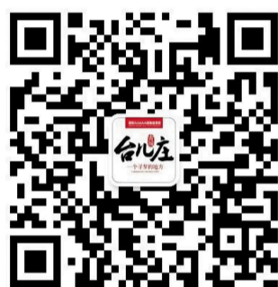
台儿庄古城微信公众号